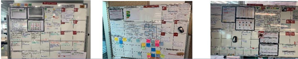
Soporte físico para las rutinas de mejora y gestión