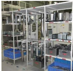
Sistema de Auditoría Trimestral