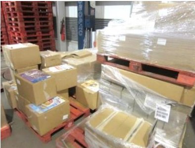
Falta de organización del material