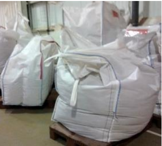
Elevados niveles de desperdicio