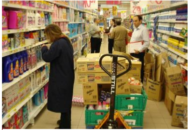
Falta de ergonomía en la reposición