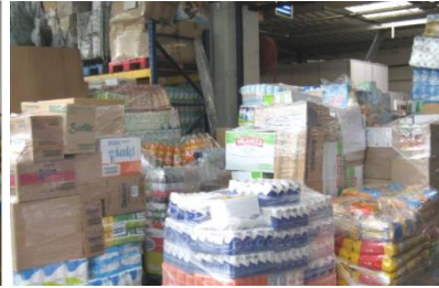
Almacenamiento innecesario de productos para reposición