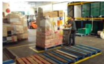
Zona de Separación