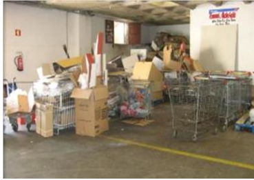
Falta de gestión visual en la organización de productos