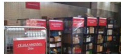
Trolleys para separación